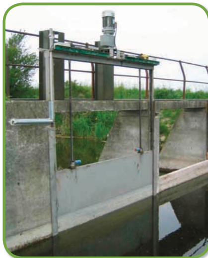
Stemmeport ved Tissø, Kalundborg

Bygværk 1 & 2: Portenes position er illustreret. For at ændre på dataene skal man logge ind. For at logge trykkes på ikonet i øverste højre hjørne, derefter får man log-ind siden.