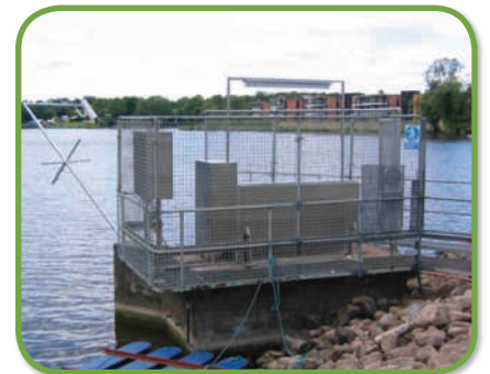
Stemmeport ved Bygholm Sø, Horsens.

STEMME- OG SLUSEPORTE LEVERES I ALLE FORMER OG STØRRELSER TILPASSET OMSTÆNDIGHEDERNE OG FOR BÅDE OVERLØB OG UNDERLØB, HYDRAULISK - ELLER ELEKTRISK SPINDELDREVNE / TANDSTANG.