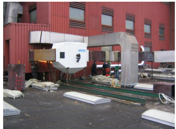
Skorstensfilter monteret i eksisterende rørføring.

Ovenstående kan kun betragtes principielt, da det i hvert projekt må anses for nødvendigt at foretage specielle tilpasninger af installationen.