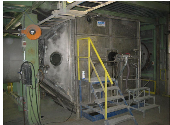
Skorstensfilter til fugtigt røg/luft.

Det fremtræder i form af en røgkasse med ind- og afgang for afkastet, med afgang for de separerede partikler og med studs for tilgang af den afblæsningsluft, der benyttes til rensning af den i røgkammeret indbyggede filtreringsenhed. Denne enhed er en intermitterent roterende tromle betrukket med en stålfilterdug af en til omstændighederne passende finhed.